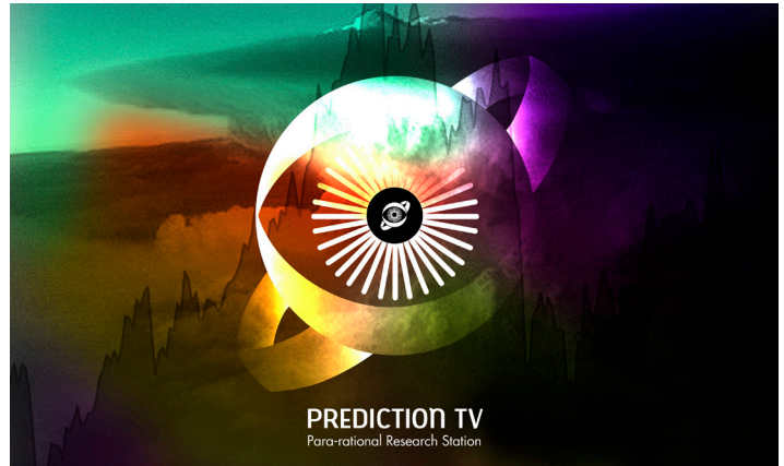
Prediction TV by Amy Suo Wu

Prediction TV – Para-rational Research Station