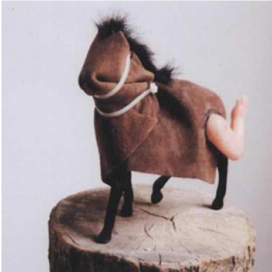
Pieter de Clerq