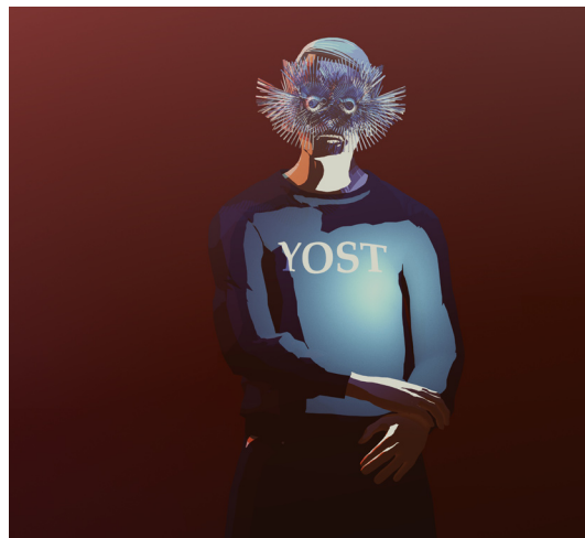
Preproduction stills CULTURESPOORT.

Uit een parallelle wereld komt CULTURESPOORT, een transhistorische anime serie over het gebruik en misbruik van technologie en de kracht van kunst. CULTURESPOORT is een epische anime geproduceerd en uitgebracht als ware het een torrent-bestand: overal vandaan, nergens eindigend. Het verhaal is zo uitgestrekt dat het een alternatieve realiteit op zichzelf vormt. MAMA nodigt je uit het universum van CULTURESPOORT te betreden in virtual reality en terug te gaan naar Rotterdam in 1995. Terwijl het decor uitdijt kom je in aanraking met personages en scenes uit CULTURESPOORT. De virtuele installatie toont de ontwikkeling van de eerste narratieve aflevering van deze meeslepende nieuwe science fiction serie die zijn oorsprong vind in Athens, Georgia (V.S.).