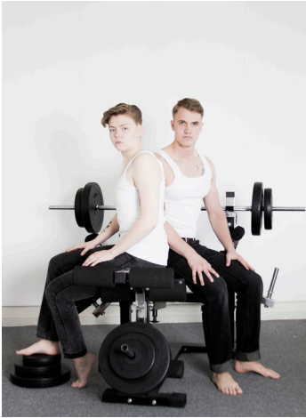
Julius Thissen, A Received Notion of Masculinity , 2014-15.